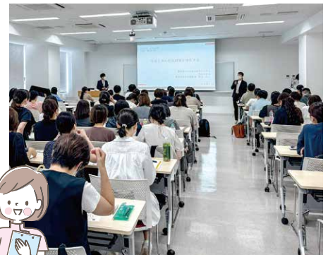
第1回事例検討会の様子

質疑応答では、質問前に隣に座る者同士がペアとなりディスカッションを行う方法を取り入れ、常に交流の機会を設けるよう工夫しました。終始和やかで質問者も回答者も発言しやすい雰囲気が生まれ、参加者から「リラックスして話すことができた」と好評でした。また、「教授からパワーをもらえた」「他分野の視点や、自身の分析の必要性など多くを学ぶことができた」等、学内・学外の参加者ともに今後の看護実践・役割発揮のモチベーションを高める貴重な時間となりました。